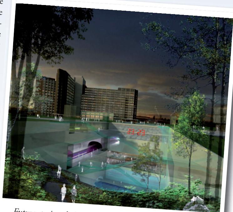
Future station de l'IGR imaginée par l'agence TVK.

Il vise à créer un pôle de recherche et d'innovation internationale entièrement dédié à la lutte contre le Cancer. Au-delà de cette dimension scientifique, il s'agit de faire éclore autour de l'IGR un éco-quartier où se côtoieront l'emploi dans des centres de recherche, de soins et d'innovation, des logements, des commerces, des