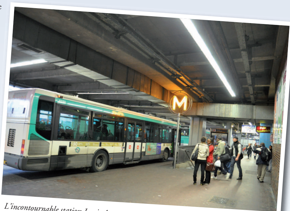
L'incontournable station Louis Aragon en connexion avec la ligne 7, le futur tramway et la gare routière.

Notre volonté de transformer cet axe en véritable boulevard urbain sous l'impulsion du Conseil général, permettra d'améliorer et d'embellir le cadre de vie des habitants, de favoriser les circulations douces et de partager équitablement l'espace entre les différents usagers.